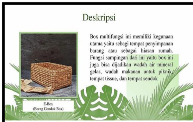
Gbr 10 Produk E-Box UMKM Klinting

E-Box merupakan kreasi box yang terbuat dari lilitan eceng gondok. Penggunaan bahan dasar eceng gondok lebih murah dibandingkan dengan bahan lainnya. Produk E-Box tersebut dapat dilihat pada gambar 10.