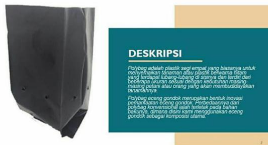
Gbr 8 Produk Biopolybag UMKM Klinting

Biopolybag ini merupakan inovasi pemanfaatan eceng gondok sebagai komposisi utama dalam pembuatan polybag sebagai tempat tanaman. Produk biopolybag tersebut dapat dilihat pada gambar 8.