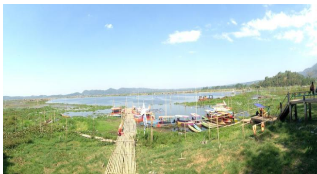
Gbr 2 Kawasan Rawapening

UMKM berbasis rumah yang memanfaatkan eceng gondok tersebar di kawasan Lopait, Muncul ataupun kawasan lain di dekat Rawapening. Pemanfaatan yang ada sekarang sebagian besar adalah pemanenan dan penyiapan eceng gondok sebagai bahan baku kerajinan. Berdasarkan data Dokumen Gerakan Penyelamatan Danau Danau Rawapening, terdapat tiga orang pengrajin sekaligus pengusaha kerajinan eceng gondok di Kawasan Rawapening yang memanfaatkannya. Ketiga pengrajin tersebut memiliki spesialisasi produksi yang berbeda, yaitu sepatu dan sandal, kerajinan tas, nampan, tempat kue, keranjang, khusus meja dan kursi. Kerajinan eceng gondok ini merupakan kerajinan yang unik, karena selama ini eceng gondok dianggap sebagai hama perairan, namun ternyata dapat berubah menjadi komoditi usaha yang menjanjikan jika diolah menjadi berbagai jenis kerajinan yang memiliki seni dengan daya jual tinggi. Namun saat ini pemasaran hasil produknya masih tergolong manual melalui mulut ke mulut, pameran dan dijual di toko, sehingga pemasarannya belum meluas.