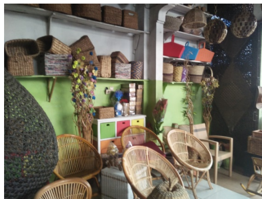
Gbr 4 Toko di Rumah (Tepi Jalan Semarang-Salatiga)

Gambar 3 menunjukkan proses pembuatan anyaman kerajinan eceng gondok yang akan dijual di beberapa homestore yang terdapat di lingkungan sekitar. Salah satu contoh homestore tersebut dapat dilihat pada gambar 4 dibawah ini: