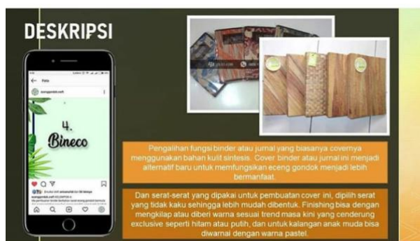
Gbr 9 Produk Bineco UMKM Klinting

Bineco merupakan cover binder atau jurnal yang dihias dengan menggunakan kreasi eceng gondok. Hal ini merupakan salah satu alternative dari pemakaian bahan kulit sintesis pada biasanya. Produk bineco tersebut dapat dilihat pada gambar 9 dibawah ini: