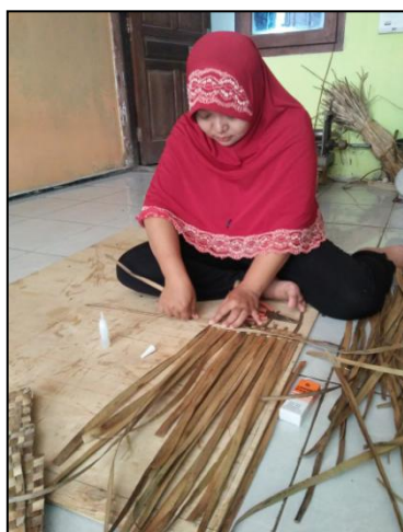
Gbr 3 Proses Pembuatan Anyaman Kerajinan Eceng Gondok Sumber : Dokumentasi Tim Pengabdian

UMKM berbasis rumah yang memanfaatkan eceng gondok tersebar di kawasan Lopait, Muncul ataupun kawasan lain di dekat Rawapening. Pemanfaatan yang ada sekarang sebagian besar adalah pemanenan dan penyiapan eceng gondok sebagai bahan baku kerajinan. Berdasarkan data Dokumen Gerakan Penyelamatan Danau Danau Rawapening, terdapat tiga orang pengrajin sekaligus pengusaha kerajinan eceng gondok di Kawasan Rawapening yang memanfaatkannya. Ketiga pengrajin tersebut memiliki spesialisasi produksi yang berbeda, yaitu sepatu dan sandal, kerajinan tas, nampan, tempat kue, keranjang, khusus meja dan kursi. Kerajinan eceng gondok ini merupakan kerajinan yang unik, karena selama ini eceng gondok dianggap sebagai hama perairan, namun ternyata dapat berubah menjadi komoditi usaha yang menjanjikan jika diolah menjadi berbagai jenis kerajinan yang memiliki seni dengan daya jual tinggi. Namun saat ini pemasaran hasil produknya masih tergolong manual melalui mulut ke mulut, pameran dan dijual di toko, sehingga pemasarannya belum meluas.