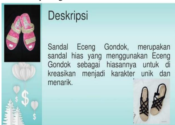
Gbr 7 Produk Sen.dok UMKM Klinting

Sen.dok adalah singkatan dari sandal eceng gondok, yang merupakan sandal hias yang menggunakan kreasi eceng gondok sebagai hiasannya. Produk sen.dok tersebut dapat dilihat pada gambar 7 dibawah ini :