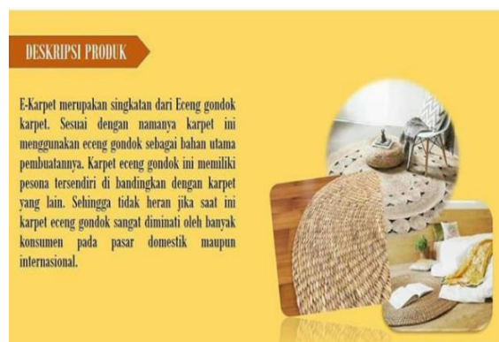
Gbr 13 Produk E-Carpet UMKM Klinting

E-Carpet merupakan kreasi tanaman eceng gondok yang dibuat menjadi karpet. Desain karpet dari bahan eceng gondok ini terlihat lebih alami dan menarik. Contoh produk e-carpet tersebut dapat dilihat pada gambar 13.