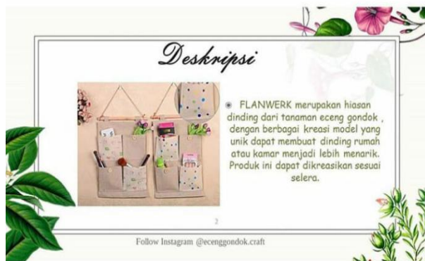
Gbr 12 Produk Flanwerk UMKM Klinting

Flanwerk merupakan hiasan dinding yang dibuat dengan bahan dari tanaman eceng gondok. Produk flanwerk hasil dari UMKM Klinting dapat dilihat pada gambar 12.