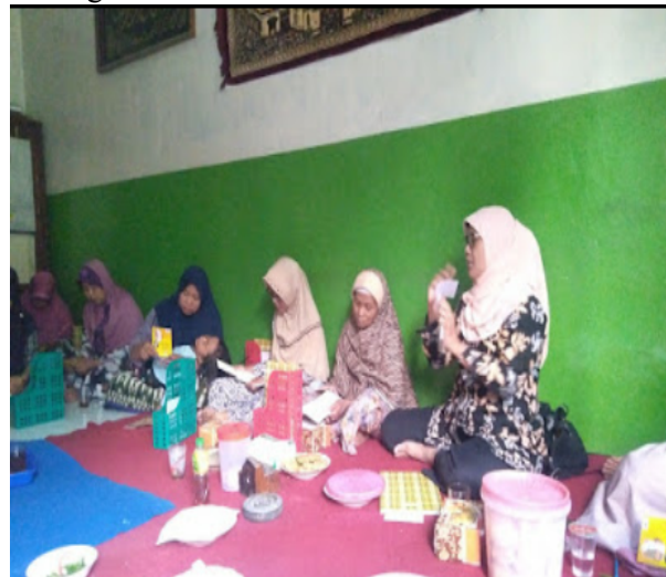
Gbr. 2 Tim pengabdian memberikan sosialisasi tentang pencatatan keuangan sederhana

keuangan sederhana dilakukan dengan cara memberikan penjelasan-penjelasan konsep-konsep akuntansi, pengertian pencatatan keuangan, manfaat pencatatan keuangan dalam dunia usaha dan prosedur pencatatan keuangan. Penjelasan atau memberikan pemahaman terhadap konsep-konsep akuntansi yang ada diharapkan pengusaha UMKM Intip memahami secara jelas tentang istilah-istilah yang ada dalam pencatatan keuangan sederhana. Pada tahap ini anggota UMKM Intip berdiskusi dengan tim pengabdian tentang istilah-istilah yang ada pada pencatatan keuangan sederhana dalam bisnis.