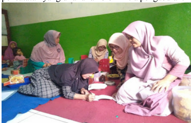
Gbr. 4 Tim pengabdian melakukan evaluasi terhadap hasil pencatatan keuangan sederhana yang dilakukan oleh mitra pengabdian.

Tahap terakhir dalam pengabdian yang dilakukan dalam pelatihan ini yakni evaluasi. Tim pengabdian melakukan pengecekan terhadap pencatatan yang telah dilakukan oleh mitra pengabdian. Pada tahap ini tim pengabdian memberikan masukan atau saran terhadap hasil pencatatan yang dilakukan oleh mitra pengabdian.