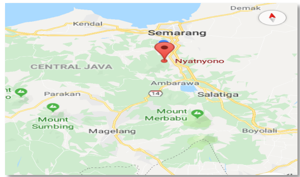
Gbr. 1 Lokasi kegiatan pelatihan di Desa Nyatnyono Kecamatan Ungaran Semarang

Pelatihan pencatatan keuangan sederhana dilakukan pada kelompok UMKM Intip di Desa Nyatnyono Kecamatan Ungaran Semarang pada bulan Juli – Agustus 2019.