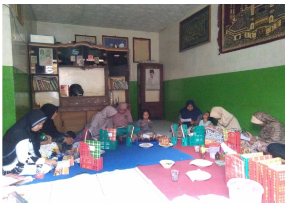
Gbr. 3 Mitra melakukan praktek pencatatan keuangan sederhana dan pendampingan dari tim pengabdian