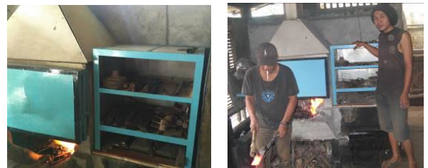
Gbr. 2 Tungku dan komponen pendukungnya di industri pande besi

tidak beraturan. Ada beberapa peralatan dan benda kerja yang terkadang ditaruh tidak teratur sehubungan pengerjaan bahan kerja yang kondisinya relatif panas. Naluri pekerja untuk segera melepas benda kerja yang kondisinya panas cukup tinggi sehingga posisi produk tempa sesaat setelah dilepas cenderung tidak beraturan. Tidak terkecuali jika produk tempa perlu perlakuan khusus termasuk pendinginan ( quenching ). Ada potensi bak cairan pendingin akan tumpah relatif tinggi jika tanpa penguat dasaran. Bak cairan pendingin sendiri dapat terbuat dari plat aluminium.