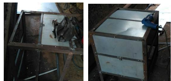
Gbr. 1 Pembuatan rak peralatan tempa dan benda kerja

Bak cairan pendingin didesain permanen untuk cairan pendingin air dan semi permanen untuk cairan khusus. Untuk cairan pendingin air menggunakan langsung bak permanen dan didesain dengan konstruksi bangunan bata semen. Untuk aplikasi khusus yakni dengan cairan pendingin khusus (oli), cairan ditaruh dalam wadah tertentu dan selanjutnya wadah tersebut diletakkan di bak permanen. Analogi dengan cairan pendingin, tempat bahan bakar didesain permanen untuk bahan bakar arang dan semi permanen untuk bahan bakar khusus (batubara, briket dan sejenisnya).