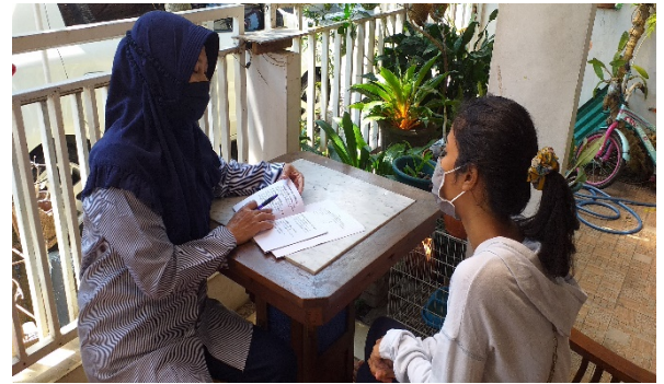
Gbr. 1 pelaksanaan edukasi dor to Dor

Acara edukasi/sosialisasi dilakukan hampir kurang lebih 1 bulan karena dilakukan melalui dor to dor dan melalui pertemuan arisan dawis dengan menggunakan protocol kesehatan