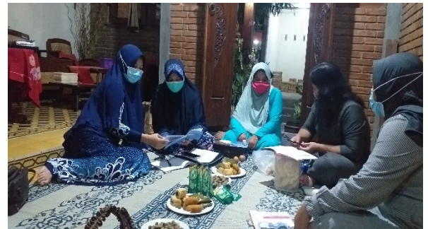
Gbr. 2 pelaksanaan Edukasi di Dawis

Pada saat kegiatan edukasi/sosialisasi, warga mendapatkan buku saku, han sanitizer, masker serta penjelasan mengenai pengertian perjanjian, hak dan kewajiban para pihak, pelaksanaan perjanjian, program pemerintah tentang relaksasi kredit karena adanya pandemic covid 19 dan cara-cara mengajukan relaksasi kredit. Pada saat acara berlangsung, warga diberikan contoh Kegiatan sosialisasi ini dihadiri oleh sekitar 35-an orangwarga. Baik yang melalui dor to dor maupun dalam pertemuan arisan dawis. Pada saat kegiatan edukasi/sosialisasi, warga mendapatkan penjelasan secara teknis mengenai bagaimana mengajukan relaksasi kredit. Warga terlihat sangat antusias dalam mengikuti rangkaian acara tersebut. Diharapkan dengan adanya edukasi ini, masyarakat dapat lebih menyadari pentingnya pelaksanaan kredit.