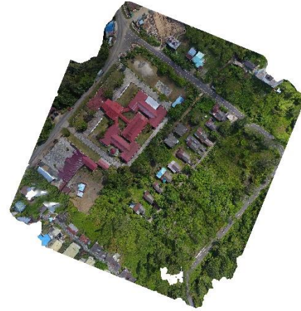
Gambar 5. Hasil pengolahan citra drone (Aplikasi Agisoft Metashape )