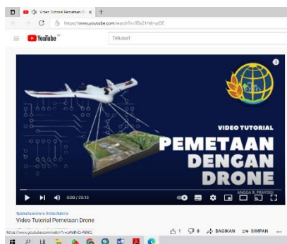
Gambar 3. Video tutorial pemetaan dengan drone