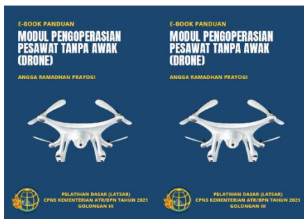
Gambar 2. E-book panduan pengoperasian drone

Pembelajaran mandiri dilakukan berdasarkan materi berupa e-book dasar pengoperasian drone ( Gambar 2 ) dan video tutorial pengoperasian drone dalam pengambilan dan pengolahan citra pertanahan ( Gambar 3 ). Sedangkan perakitan dan penerbangan drone serta pengolahan data citranya dilakukan secara bersama antara peserta dengan instruktur. Suprihatiningrum (2013) menyebutkan bahwa strategi pembelajaran merupakan siasat/taktik yang diperlukan oleh pengajar agar memperoleh hasil sesuai dengan tujuan pengajaran yang telah ditetapkan. Pada Tabel 1 disajikan strategi pembelajaran yang digunakan pada saat sharing session sehingga diharapkan peserta dapat melakukan pengoperasian dan pengolahan data citra PUNA secara sederhana.