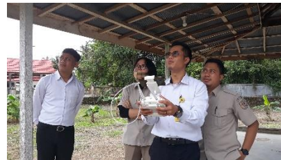
Gambar 6. Dokumentasi kegiatan

Kegiatan berikutnya adalah pendampingan pengolahan data citra hasil pemotretan drone tersebut yang dilakukan oleh instruktur dan langsung diikuti oleh peserta. Tahapan kegiatannya yaitu membimbing peserta mengeksport data dari memory card drone agar dapat dibuka/diolah menggunakan komputer/laptop dan membimbing peserta untuk mengolah data hasil pemotretan drone dengan menggunakan aplikasi Agisoft Metashape ( Gambar 5 ). Masing-masing kegiatan tersebut dilakukan penilaian capaian sebagai bahan evaluasi.