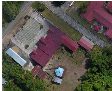
Gambar 1. Citra satelit Kantor Pertanahan Kabupaten Barito Selatan

Kegiatan dilaksanakan di lingkungan Kantor Pertanahan Kabupaten Barito Selatan dengan objek pemetaan citra udara sebagai lokasi praktek yaitu kawasan di sekitar Kantor Pertanahan Kabupaten Barito Selatan.