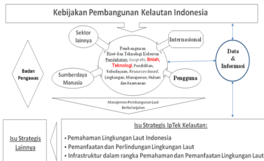
Gambar 3 Peran Teknologi dan Inovasi Kelautan

Dalam suatu kerangka pembangunan kelautan berkelanjutan yang lebih utuh, peran teknologi dan inovasi kelautan dapat digambarkan sebagai berikut :