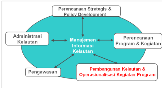
Gambar 2. Proses-proses Manajemen Kelautan

Dalam suatu kerangka pembangunan kelautan berkelanjutan yang lebih utuh, peran teknologi dan inovasi kelautan dapat digambarkan sebagai berikut :