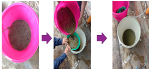
Gambar 4. Proses penyaringan dan hasil akhir produk