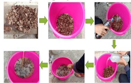
Gambar 2. Langkah-langkah persiapan bahan