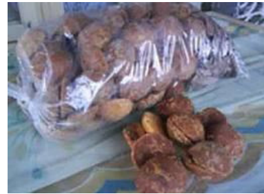
Gbr 1. Produk KUBE ( 1)

Nira merupakan cairan bening yang terdapat di dalam mayang kelapa yang pucuknya belum membuka. Nira didapat dengan cara penyadapan atau penderesan. Satu buah mayang dapat disadap selama 10 – 35 hari, namun produksi optimal selama 15 hari. Hasil nira sekitar 0,5 – 1 liter nira permayang, atau sekitar 2 -4 liter nira per pohon setiap hari.