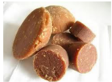
Gbr 2. Produk KUBE ( 2)