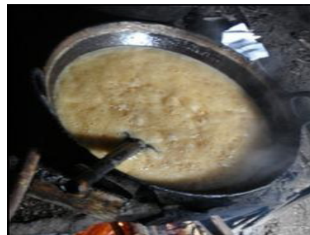
Gbr 3. Bejana Pemasak

Dari tinjauan lapangan rata produsen Gula Merah adalah petani dan ibu rumah tangga, maka kendala yang dihadapi rata-rata sama, modal dan kualitas belum sama, untuk itu disepakati permodalan oleh Dinas Koperasi dan UMKM Kabupaten Semarang. Sedangkan untuk kontrol kualitas diharapkan Fakultas Teknik Undip. Sehingga diperlukan bejana pemasakan nira lengkap dengan peralatan pengadukan, penataan tungku dengan menggunakan bahan bakar